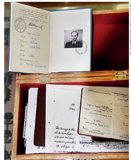
Rzeczy osobiste Raoula Wallenberga wydane przez Rosjan w 1989 roku.

Dwa lata później rządy Szwecji i ZSRR zdecydowały się powołać wspólną grupę roboczą, żeby uporządkowała wiedzę na temat losów Wallenberga. Raporty z prac tej grupy opublikowano w 2001 roku. Brak w nich jednoznacznych ustaleń, stwierdzają jedynie, że wiele ważnych pytań nadal pozostaje bez odpowiedzi i w związku z tym sprawy Wallenberga nie może uznać za ostatecznie zamkniętą.