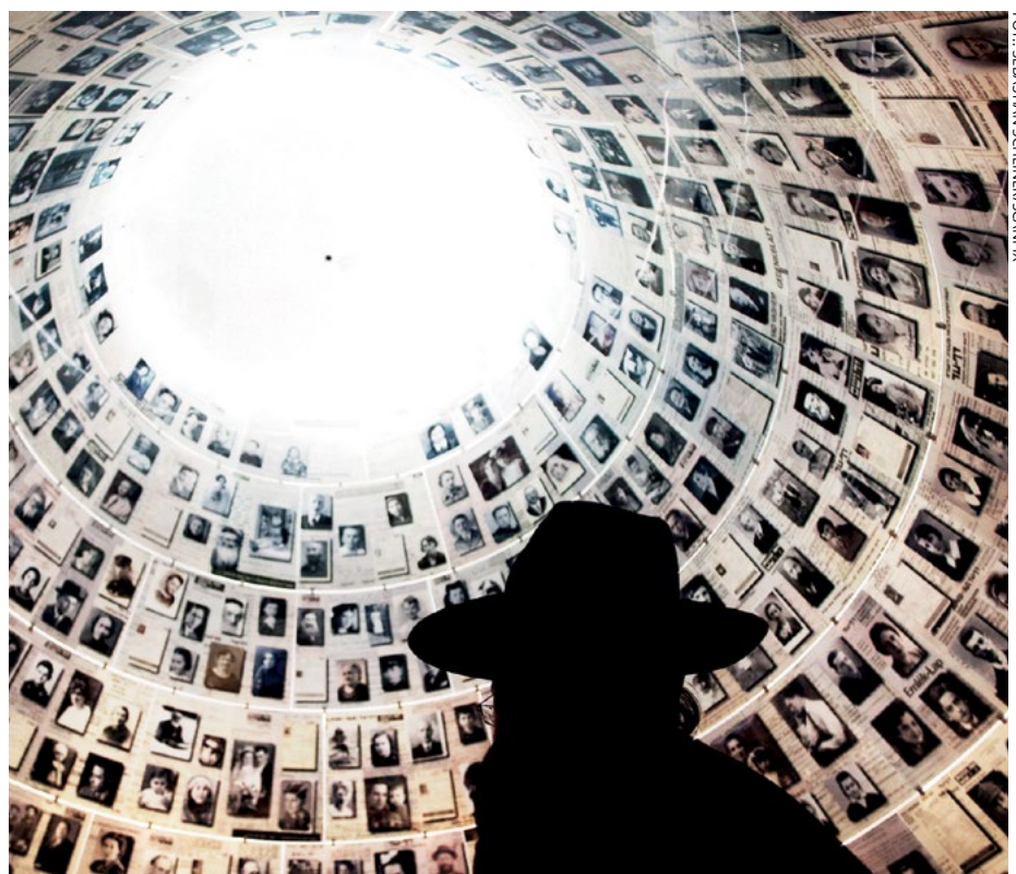
Hala Imion w Yad Vashem w Jerozolimie.

W październiku 2001 roku rząd szwedzki powołał oficjalną komisję śledczą, tzw. Komisję Eliassona, która miała przeanalizować działania podejmowane przez szwedzką dyplomację w sprawie Raoula Wallenberga. W 2003 roku opublikowano raport podsumowujący. Kroki podejmowane na szczeblu politycznym przedstawiono w rozdziale zatytułowanym „Dyplomatyczna porażka”. ■